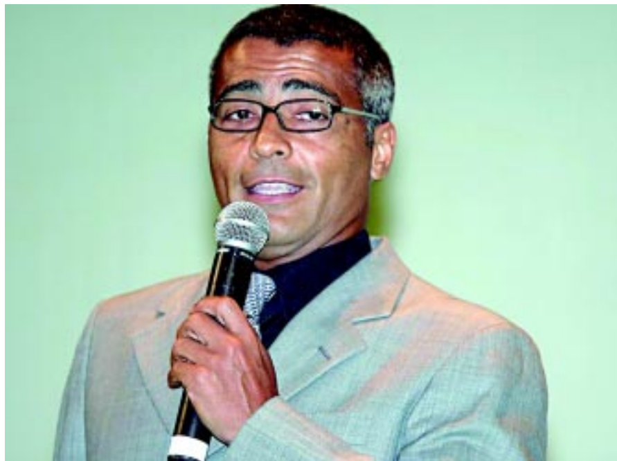
Em entrevista no México, o deputado Romário diz que no máximo sete dos 12 estádios previstos para Copa do Mundo do Brasil em 2014 será concluídos

"O meu balanço, infelizmente, não é muito positivo.