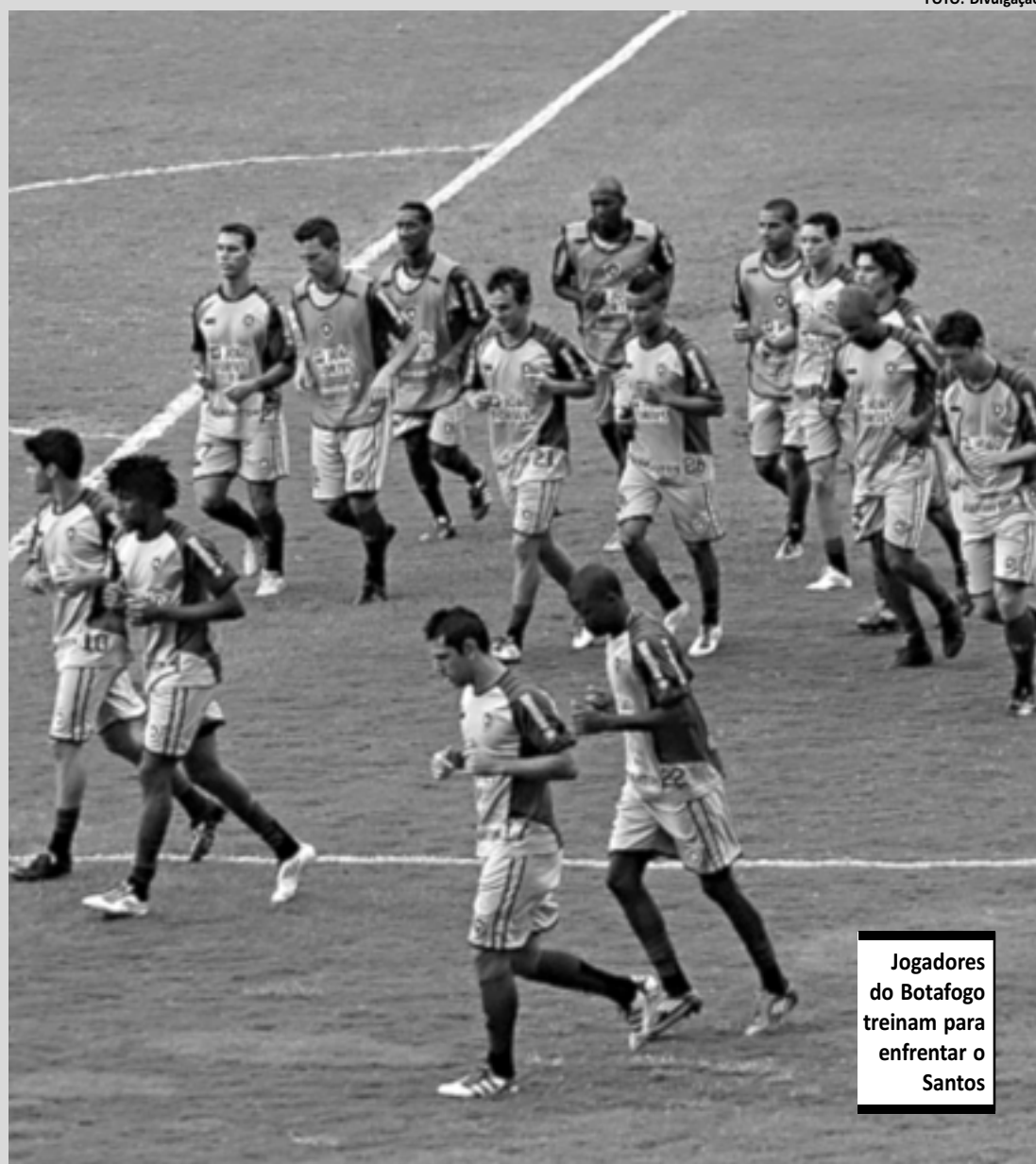
Jogadores do Botafogo treinam para enfrentar o Santos