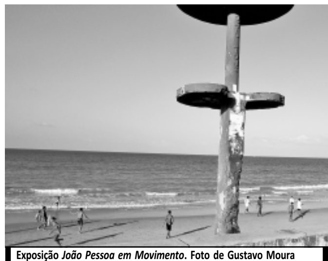
Exposição João Pessoa em Movimento.

A exposição João Pessoa em Movimento segue aberta ao público até o dia 6 de novembro, das 8h às 18h. Mais informações podem ser obtidas pelo telefone 3031-1250.