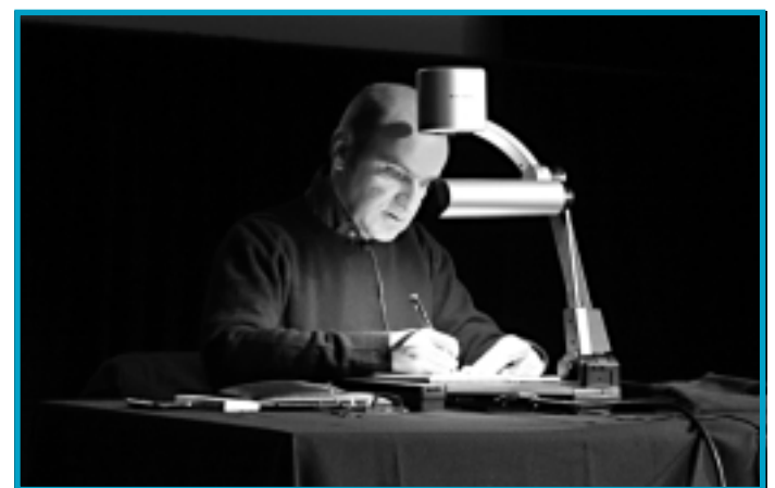
ÁLBUM DE LEWIS TRONDHEIM NA COMIC HOUSE