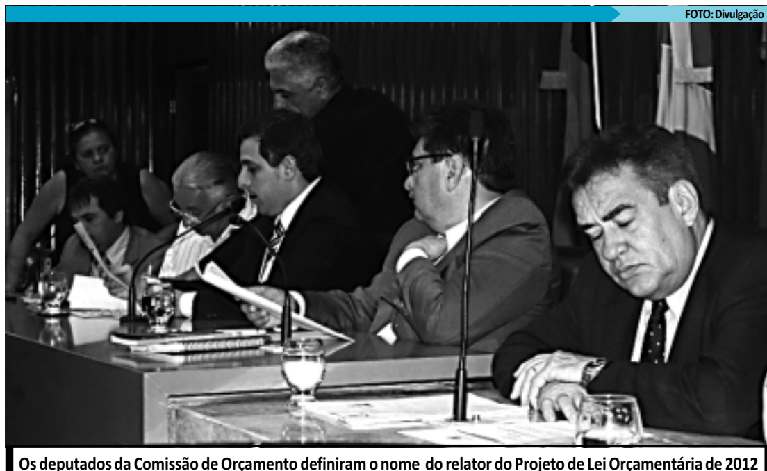
Os deputados da Comissão de Orçamento definiram o nome do relator do Projeto de Lei Orçamentária de 2012

Uma das matérias do Governo diz respeito ao Projeto nº 369/2011, que altera dispositivos da Lei nº 6.379, de 2 de dezembro de 1996, que dispõe sobre ICMS. Por último, foi aprovado o Projeto de Lei nº 573/2011, que uniformiza o procedimento administrativo para constituição de crédito não tributário do Estado da Paraíba, não disciplinado em legislação específica.