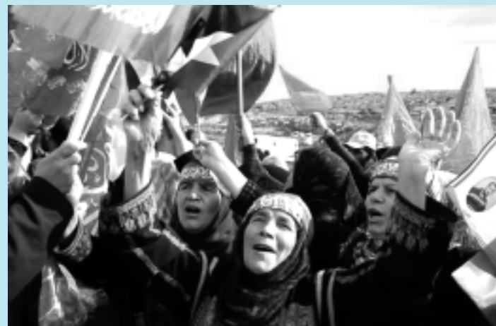
A comunidade palestina comemora a libertação de companheiros; soldado Gilad Shalit bate continência a Netanyahu na chegada a Israel