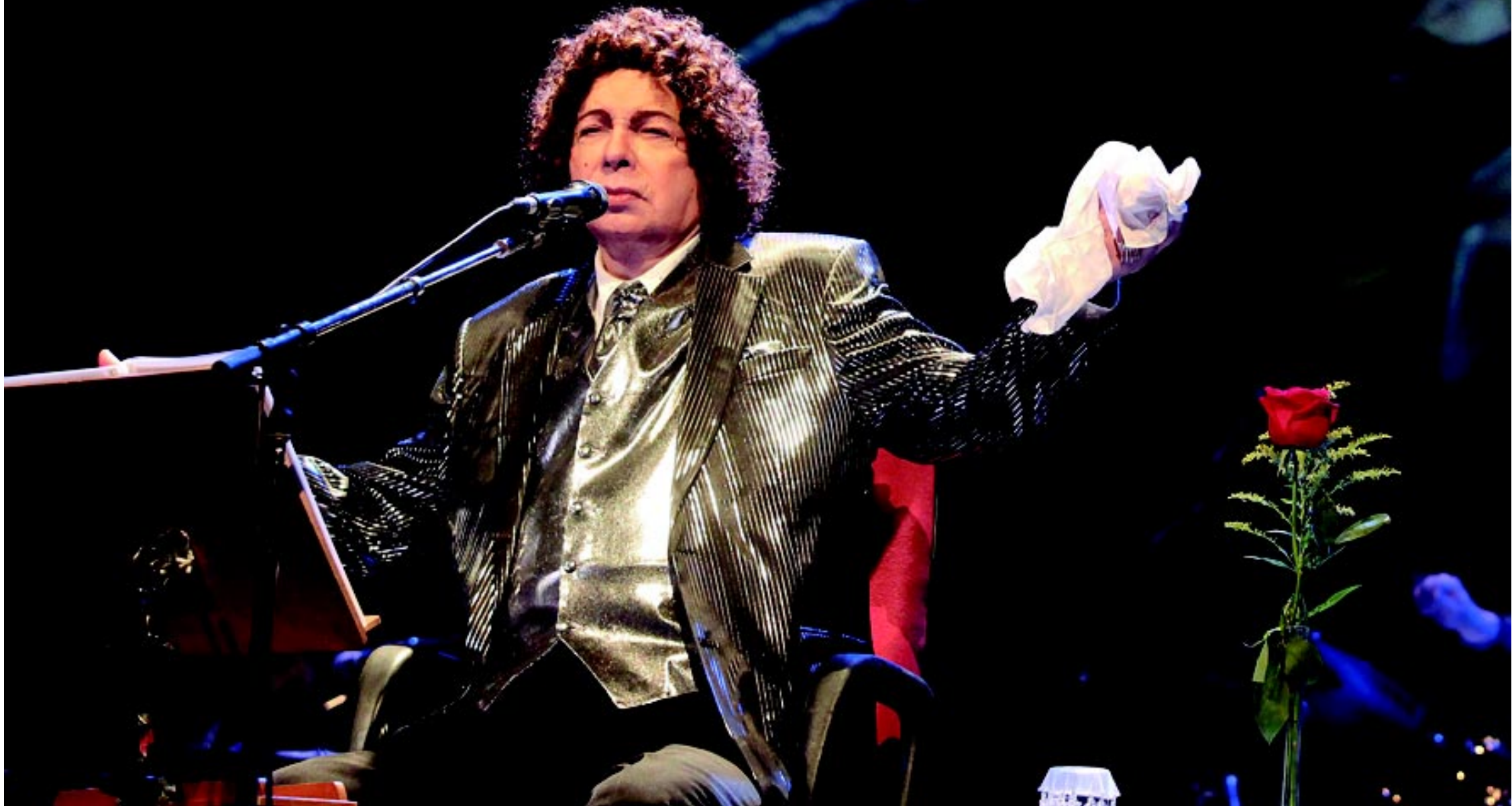
Cauby Peixoto tem uma história maior com o rock and roll do que se supõe. Em 1957, ele lançou no Brasil 'Rock and Roll em Copacabana', apontado como o primeiro gênero da espécie lançado em português

A caixa Cauby - O Mito - 60 Anos de Música , da Lua Music, traz os CDs A Voz do Violão , Caubeatles e Cauby ao Vivo - 60 Anos de Música , que sai também em DVD