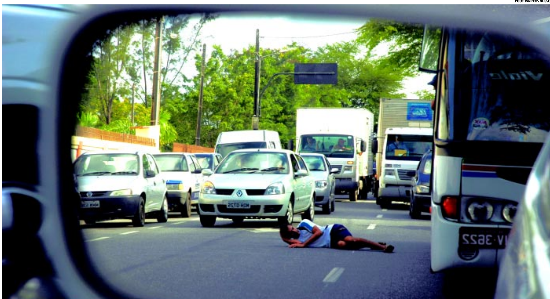
FLAGRANTE | Homem passa mal, cai na Avenida Aderbal Piragibe e por pouco não é atropelado PÁGINA 9

A 'Máfia do Supletivo' pode ter movimentado algo em torno de R$ 330 mil apenas na aplicação dos exames no último fim de semana. O Conselho de Educação sugeriu que os candidatos lesados procurassem a Justiça para receber de volta o dinheiro. PÁGINA 11