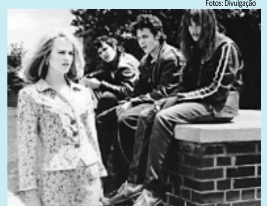
Cena de Um Sonho Sem Limites de Gus Van Sant

>>> UM SONHO SEM LIMITES - Suzanne Stone é uma garota bonita nascida em uma cidadezinha do interior. Ela sonha tornar-se famosa na televisão e vai tentar a sorte na cidade grande. Casada com Larry Maretto, dono de uma pizzaria, ela anda desiludida e se dedica em tempo integral à carreira como repórter na TV local, onde compensa seu limitado talento com muita sujeira, sexo e até mesmo mortes para chegar ao estrelato. SE LIGUE: Hoje, às 23h, no Liv