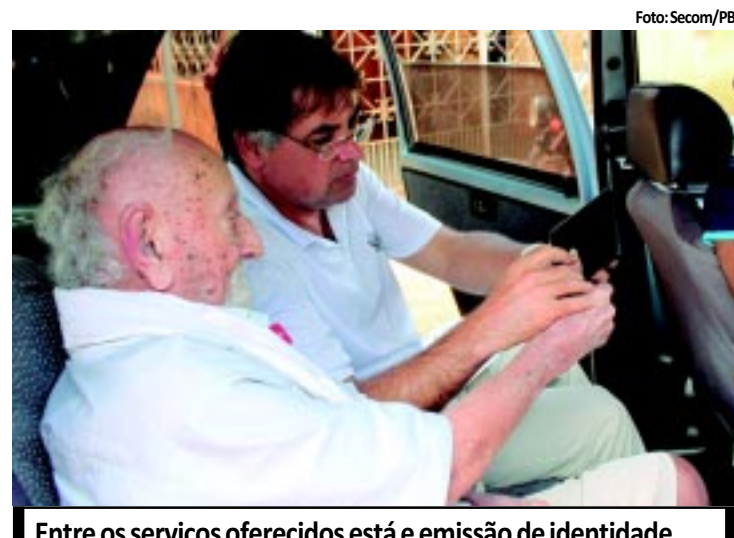
Entre os serviços oferecidos está e emissão de identidade