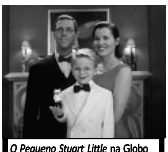
O Pequeno Stuart Little na Globo