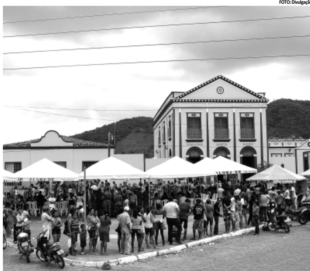
O número de pessoas atendidas bateu recorde do Programa do Governo do Estado. Confira programação

Para novembro, a agenda itinerante percorre os municípios de Ingá (8), Riachão do Bacamarte (9), Serra Redonda (10), Gurinhém (11), Baía da Traição (14), Tavares (16), Cajazeirinhas (17), Cabimbas (18) e Sousa (21 e 22).