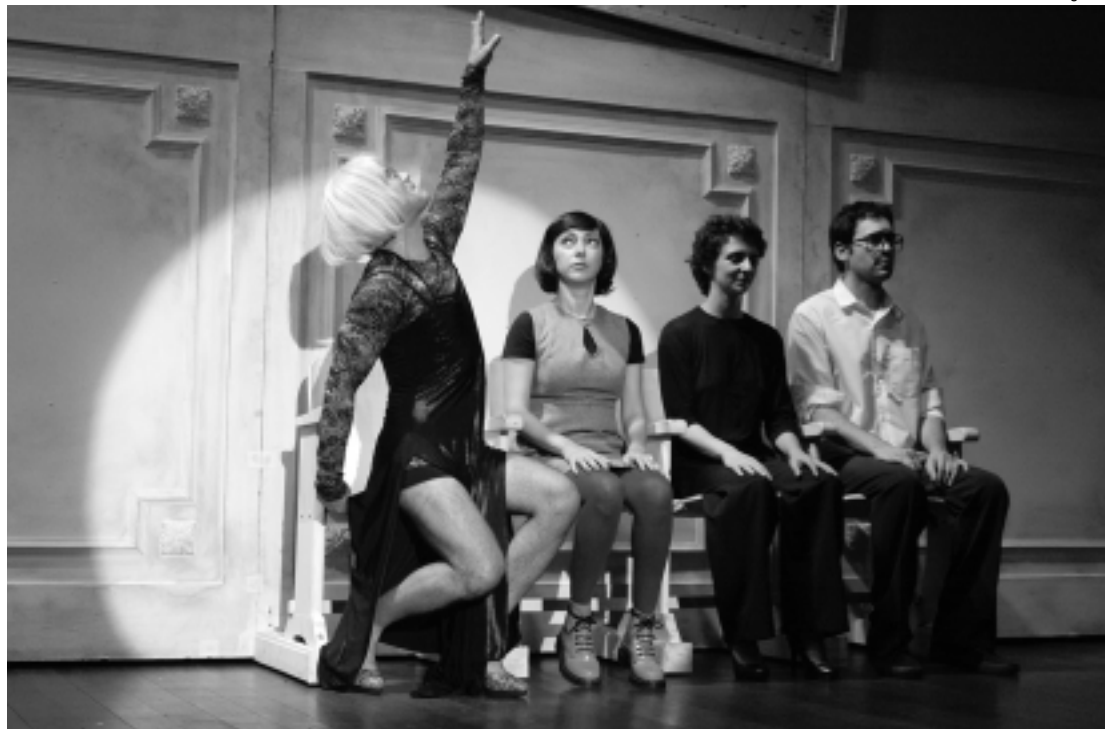
Vida é o resultado de um longo e profundo período de pesquisas sobre a obra do poeta curitibano Paulo Leminski

A partir da relação dos quatro personagens, se transformando - a si próprios e aos