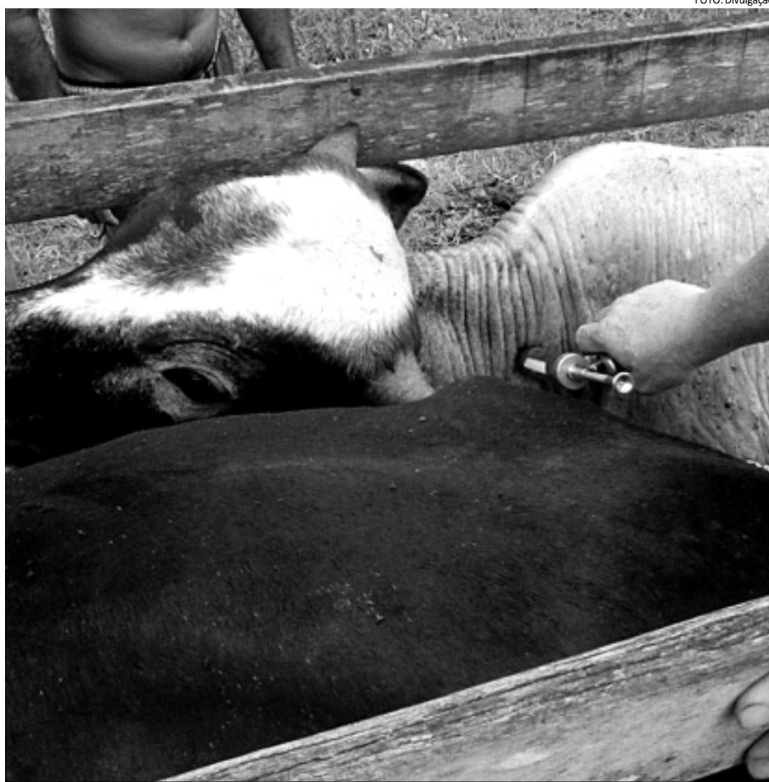
Aplicação de vacina se insere na pauta da implantação do Sistema Unificado de Atenção à Sanidade Agropecuária

O projeto, intitulado "Incentivando Adolescentes para o Desenvolvimento de uma Sexualidade Saudável em Escolas Públicas de Nível Fundamental de João Pessoa", realizou pesquisa nas Escolas Estaduais João Navarro e Celestin Malzac, no bairro Valentina Figueiredo, e fez uma pesquisa de campo para avaliar a real ciência de informações dos adolescentes sobre os métodos preventivos para iniciar uma intervenção. Participaram da pesquisa 570 alunos - a maior parte meninos, com média de idade de 13,8 anos. Desse total, 21,1% afirmaram já ter iniciado a vida sexual, sendo que 45% não usaram método anticoncepcional (MAC), 45% usaram condom (camisinha), 3,3% usaram contraceptivo hormonal e apenas 2,3% fizeram uso da dupla proteção (camisinha e contraceptivo hormonal).