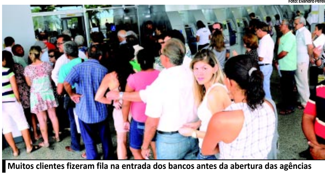
Muitos clientes fizeram fila na entrada dos bancos antes da abertura das agências

O primeiro dia de atendimento bancário, após o fim da greve, foi marcado por longas filas e espera dos clientes que precisavam fazer transações bancárias. As agências do Banco do Brasil e da Caixa em João Pessoa foram as que apresentaram maior movimentação. A expectativa é de que até segunda-feira o fluxo de clientes seja normalizado. PÁGINA 9