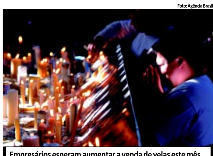
Empresários esperam aumentar a venda de velas este mês

duais. A maior parte dos adolescentes pesquisados iniciou a vida sexual sem conhecer o funcionamento do corpo e dos métodos preventivos. Além de ficarem expostos à gravidez precoce e indesejada, ainda correm o risco de contrair doenças sexualmente transmissíveis. PÁGINA 9